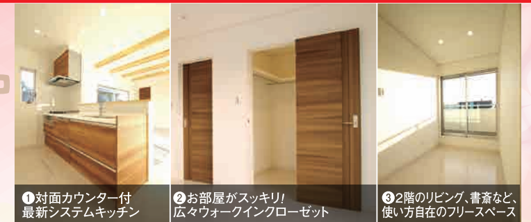
① 対面カウンター付最新システムキッチン ② お部屋がスッキリ! 広々ウォークインクローゼット ③ 2階のリビング、書斎など、使い方の自在なフリースペース