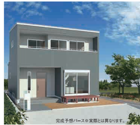
完成予想パース※実際とは異なります。