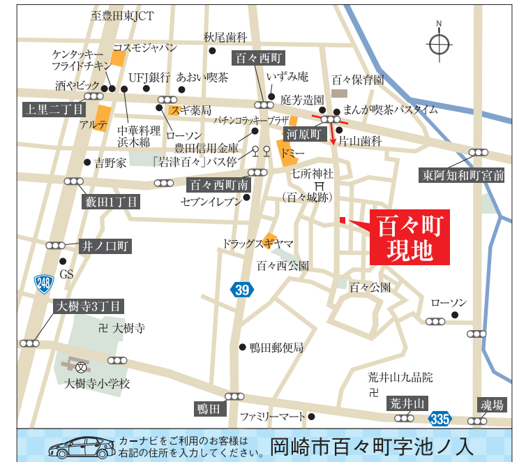
カーナビをご利用のお客様は右記の住所を入力してください。岡崎市百々町字池ノ入