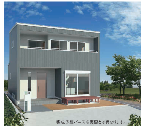
完成予想バス※実際とは異なります。