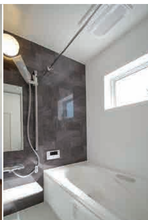
⑧ゆりのシステムバス