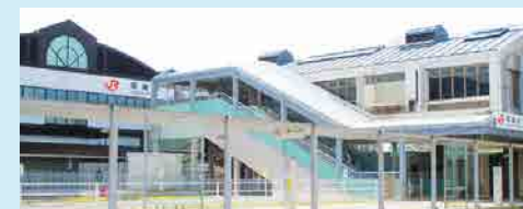
JR東海道本線「岡崎」駅東口 岡崎の玄関口。ターミナル駅です。

■土地面積/135.29㎡(40.92坪) ■延床面積/141.09㎡(42.67坪)