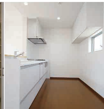
⑥収納付最新システムキッチン