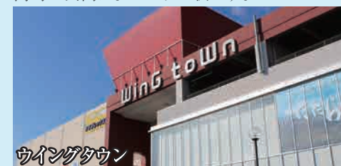
ウイングタウン 映画やショッピングを楽しむ