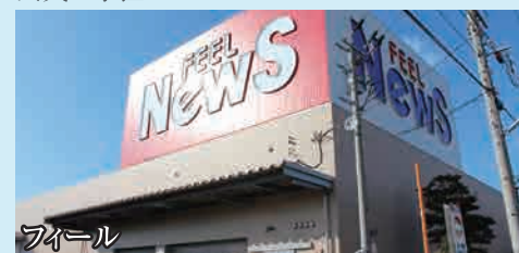
フェアール 新鮮な食材がいっぱい