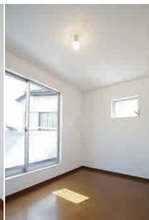
⑦陽当良好プライベートルーム