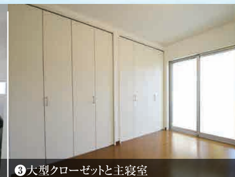
③大型クローゼットと主寝室

JR東海道本線「岡崎」駅自転車8分! ※距離は地図上の概測で、自転車分数は250m/1分で算出した概算時間です。