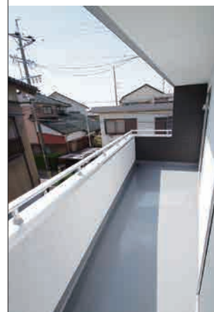
④広々インナーバルコニー

★趣味が活せるガレージハウス。大容量シューズBOX、インナーバルコニーなど見どころ満載!