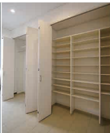
⑤大きな玄関とシューズBOX