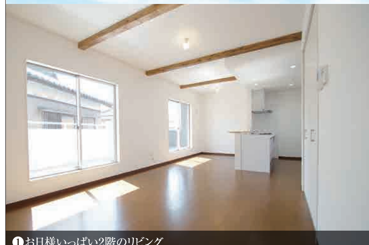
①お日様いっぱい2階のリビング