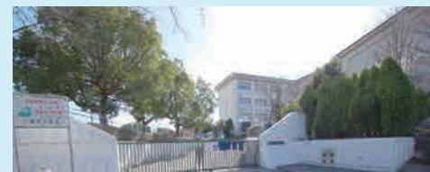
小豆坂小学校 人気の学区