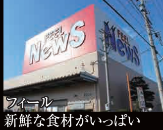
フィール 新鮮な食材がいっぱい