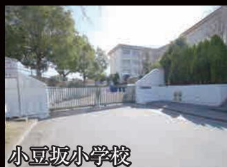
小豆坂小学校 人気の学区