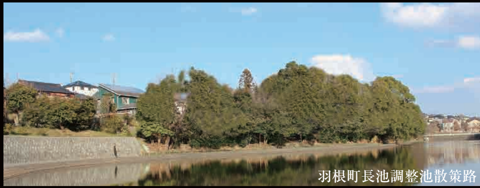
羽根町長池調整池散策路 ウォーキングやジョギングを楽しむ