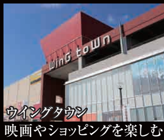
ウイングタウン 映画やショッピングを楽しむ