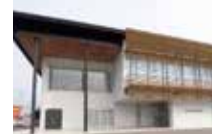
●JAあいち三河 幸田支店